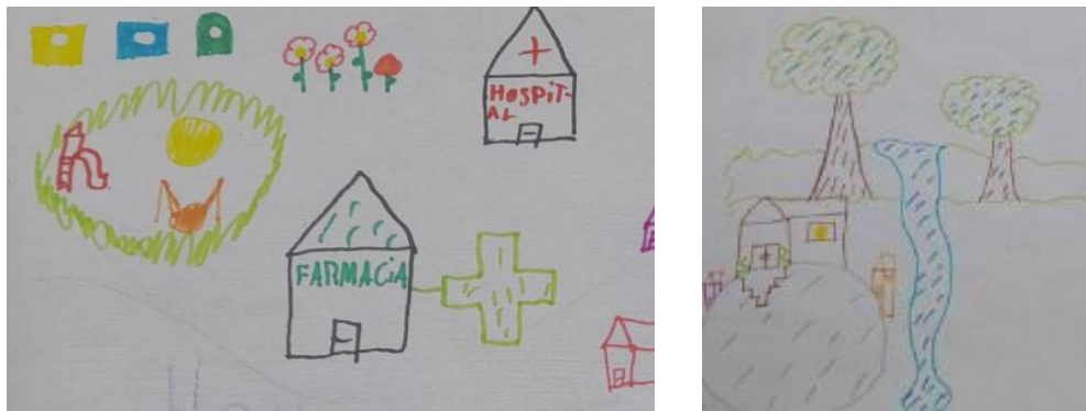
Fotos extraídas de los dibujos de los niños y las niñas de Vall de Almonacid en la dinámica participativa.